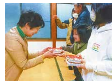
1. 鹿島地区民生児童委員協議会