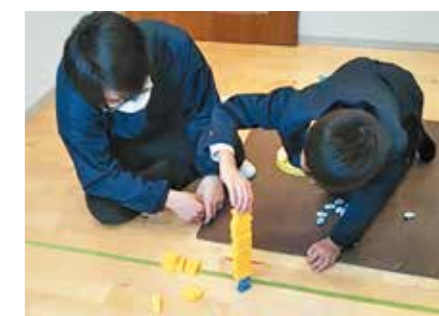
8. 多機能型支援センター「そら」