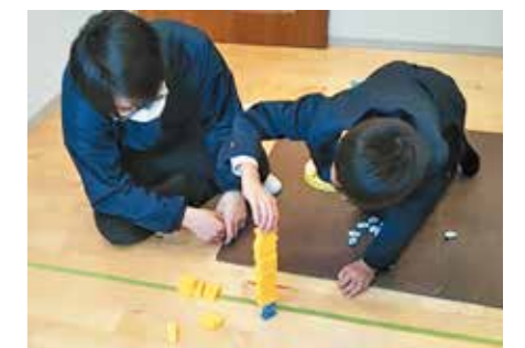
8. 多機能型支援センター「そら」