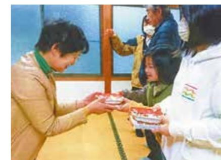
1. 鹿島地区民生児童委員協議会