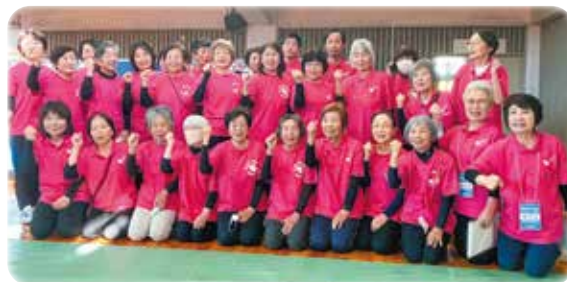
鹿島市レクリエーション協会の皆さん

48チーム96名が参加され、当日はジュニアリーダーズクラブの皆さんにも協力していただきました。また鹿島市食生活改善推進協議会の皆さんによるカレーライスのふるまいもありました。