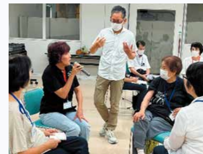
傾聴ボランティア養成講座