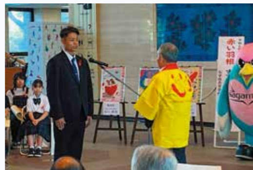
共同募金運動出発式