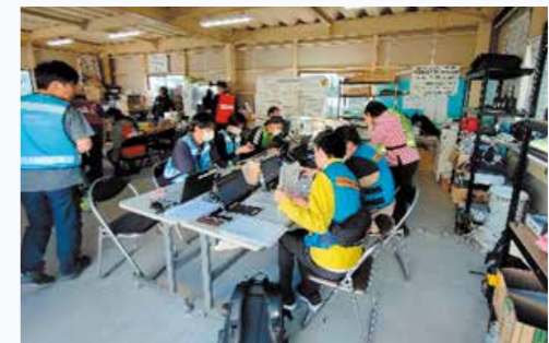
災害ボランティアセンター運営支援(石川県珠洲市)