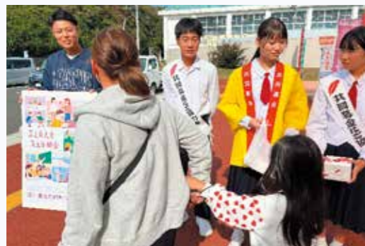
市内商業施設前での街頭募金活動